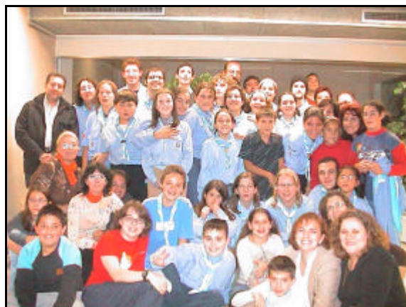
miembros del Grupo Scout Makarenko

“Los niños pueden liberar a los niños, los niños pueden hacer muchas cosas para los niños. Es cuestión de sensibilizarlos, llamar su atención sobre la difícil vida que llevan muchos niños del mundo... Lo que nos falta a los seres humanos no es fuerza, sino voluntad.”