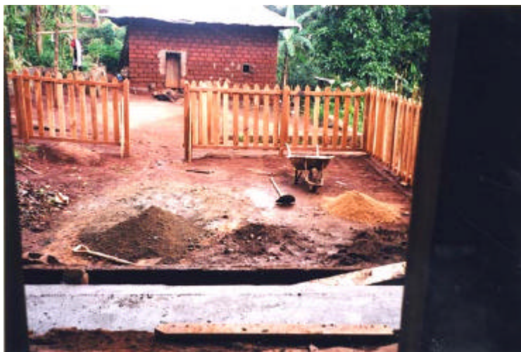
Edificio de la guardería

Las familias de los niños, especialmente las madres.