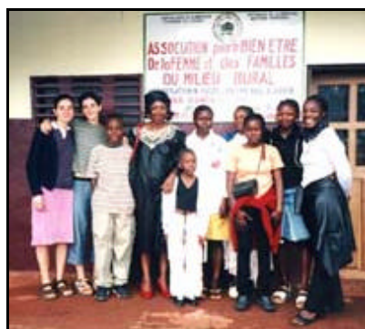
miembros de AFFAMIR